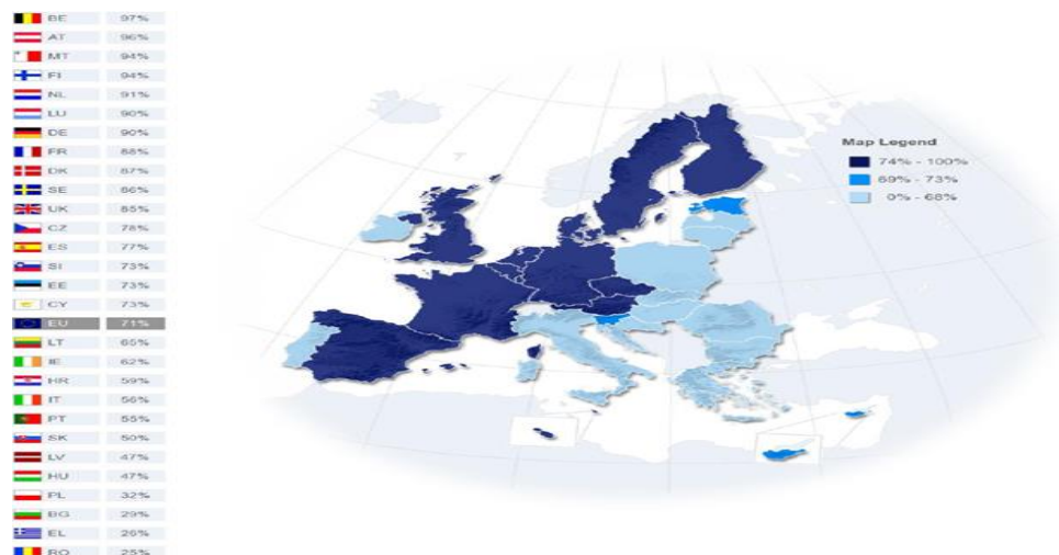
Fig. 1. Evaluarea calității generale a asistenței medicale în țările UE cf, Special Eurobarometru 411, 2014

În privința efectelor adverse, respondenții care trăiesc în zonele de nord și vest ale UE au declarat că ei sau un membru al familiei au întâmpinat un astfel de episod în timpul asistenței medicale: Suedia (53%), Danemarca (49%) și Țările de Jos (46%) (Fig. 2). În mod paradoxal, proporția efectelor adverse nu pare a fi legată de percepția generală a calității asistenței medicale, deoarece cel puțin 86% dintre respondenții din aceste țări au evaluat calitatea generală a asistenței medicale ca fiind bună.